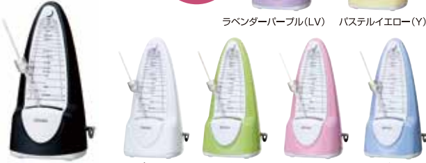
ノールブラック(B) ビュアホワイト(W) ライムグリーン(G) チェリーピンク(C) スカイブルー(M)