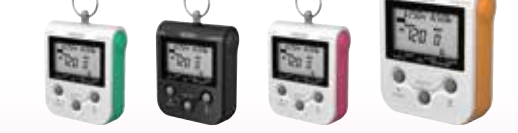
アップルグリーン(G) ブラック(B) ラズベリーピンク(P) マンゴーオレンジ(O)