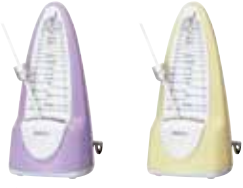
ラベンダーパープル(LV) パステルイエロー(Y)