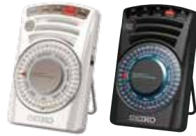
ホワイト(W) ブラック(B)