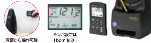
背面から操作可能