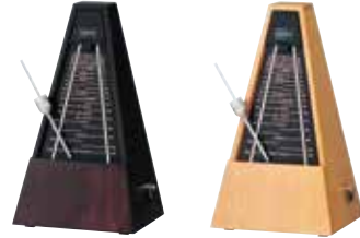
クラシックブラウン(B) ナチュラル(N)