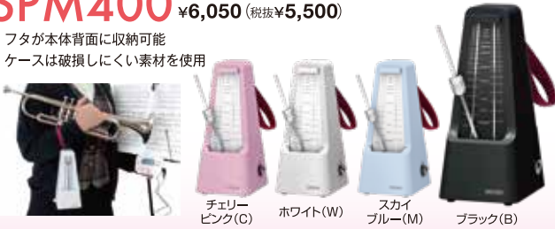
チェリーピンク(C) ホワイト(W) スカイブルー(M) ブラック(B)